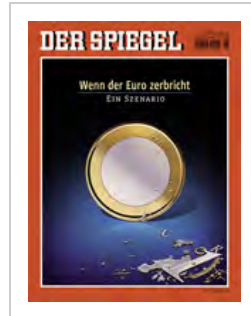
10. Platz 6/2012