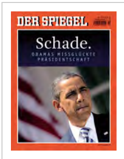
6. Platz 6/2012