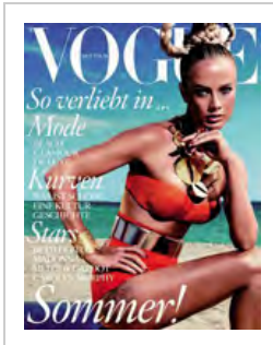
9. Platz 6/2012